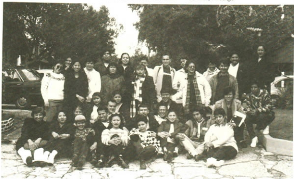
Seminario-Taller de Planificación General 7 al 10 de octubre de 1999 - Pachuca, Hidalgo